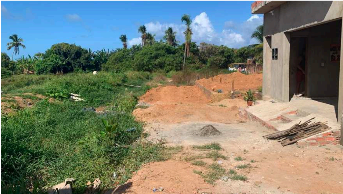
IMAGEM 06 – RUA 02 LOCALIZAÇÃO