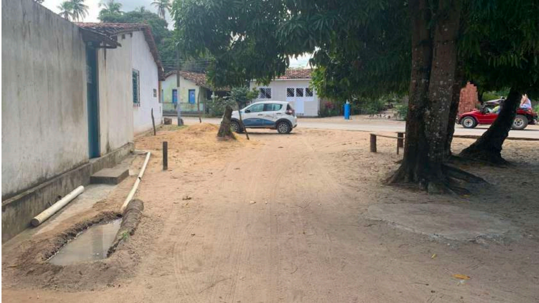
IMAGEM 08 – RUA 03